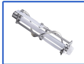
Batidor de acero inoxidable