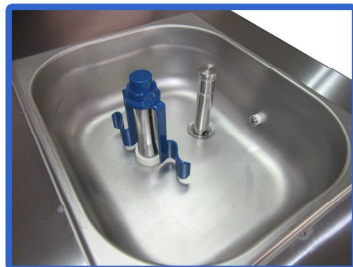
Agitador del depósito